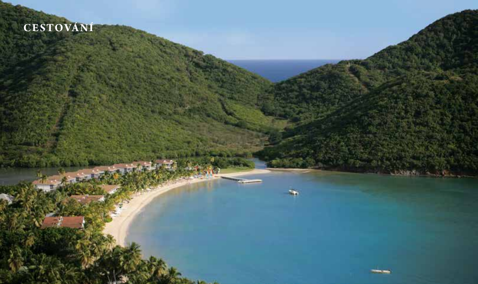
Antigua a Barbuda – Carlisle Bay

S ám pobyt na zaoceánské lodi přináší jednak spoustu času pro příjemný odpočinek, současně však nabízí i nepřeberné množství příležitostí dobře se bavit: relaxační centra s vířivkami, bazénem a špičkovými maséry, perfektně vybavená fitnesscentra, ale i knihovny s internetem, kasina, kina, koncerty živé hudby. A když už jsem u požitků, lodě nabízejí pestrý výběr restaurací a barů. Na všech palubách je v bufetových i v samoobslužných restauracích až na výjimky jídlo v ceně, stačí si jen dokoupit nápojový balíček. Po sedmé hodině ranní mne vítají dva dramaticky tyčící se vulkanické vrcholky Petit Piton a Gros Piton, dosahující výšky až 797 m, podle kterých je ostrov Svatá Lucie dobře rozeznatelný. Oba vrcholy jsou od roku 2004 zapsány na seznamu přírodních památek UNESCO.