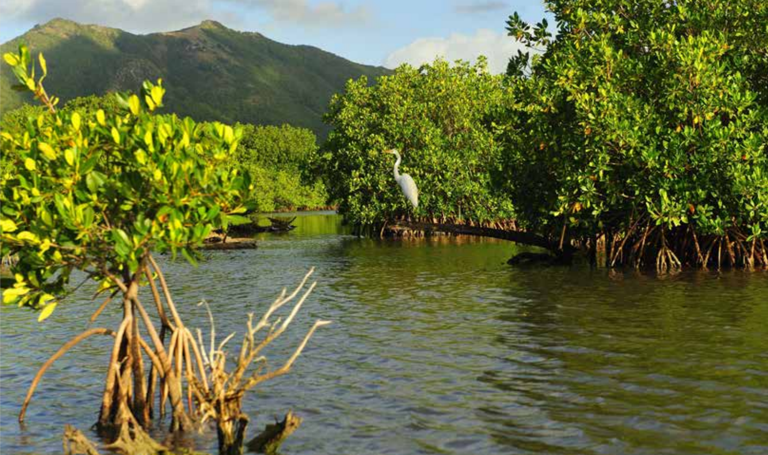
Projížďka loďí mezi mangrovnikovými porosty na Svaté Lucii

lantský oceán a smaragdové vody Karibiku. Na hřišti mne zaujal poměrně otevřený prostor ke hře, nicméně fairway jsou i tak z jedné strany hlídány nebezpečnými vodními překážkami a z druhé strany stromy. Fascinující je okolní příroda a divoce žijící zvířata, která se na hřišti volně pohybují. Saint Lucia Golf & Country Club je každoročně hostitelem Moet/Hennessey turnaje, v říjnu pak turnaje Rotary Clubu, který se koná již několik let. Cena green fee činí 2300 Kč, pronájem holi značky Callaway 500 Kč a pronájem golfových bot 250 Kč. Ceny tedy nijak přemrštěné.