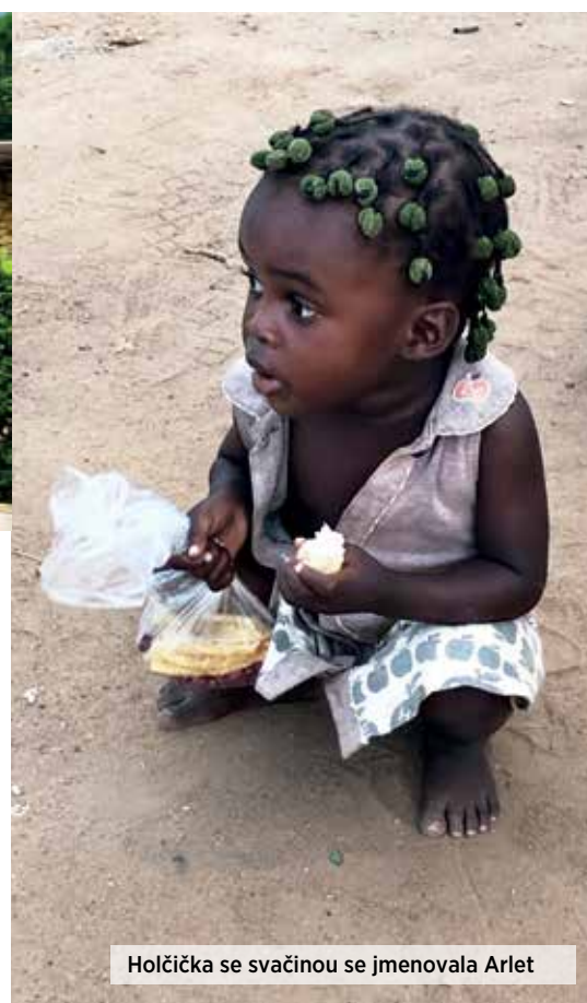
Hořička se svačinou se jmenovala Arlet

Angolu mám od dětství spojenou s únosem československých občanů 12. března 1983 během občanské války. Film „Osudové okamžiky“, který byl později natočen, mám v živé paměti. Povstalecký Národní svaz za úplnou nezávislost Angoly (UNITA) tehdy zajal 66 Čechoslováků , včetně žen a dětí, kteří tam byli vysláni obnovit provoz místní papírny. Všichni byli donuceni k pochodu , jenž měl neuvěřitelných 1320 kilometrů . Někteří byli drženi v zajetí až rok a půl , jeden člověk nepřežil .