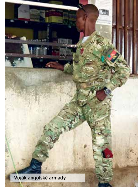
Voják angolské armády

černé pivo Cuca. Po cestě do Luandy mi zbývá z plánu krátká zastávka u přírodního skvostu Miradouro da Lua. Je to soubor útesů 40km jižně od Luandy, v obci Samba. Během eroze způsobené větrem a deštěm se zde vytvořila doslova měsíční krajina.