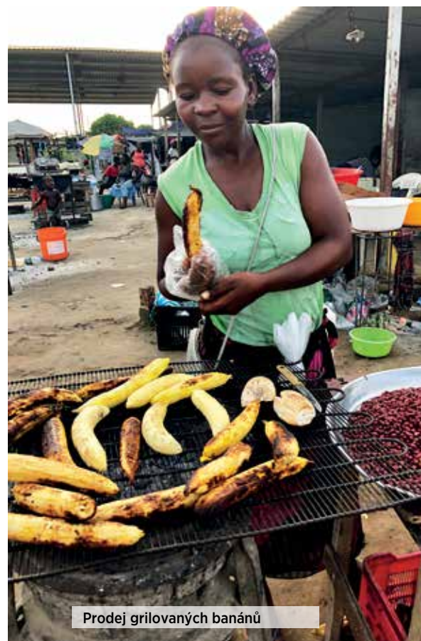
Prodej grilovaných banánů