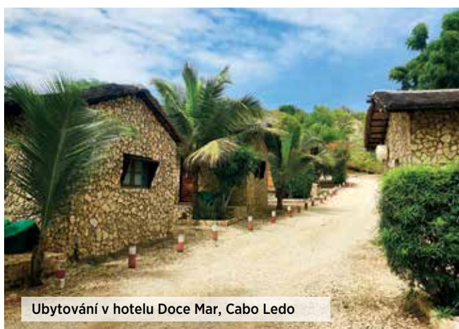
Ubytování v hotelu Doce Mar, Cabo Ledo