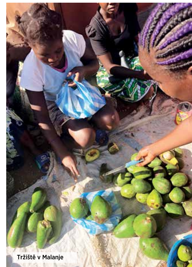
Tržiště v Malanje