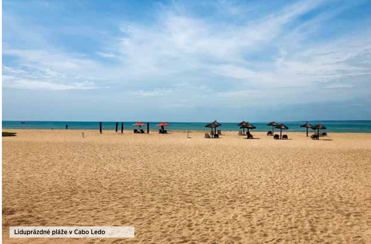
Liduprázdné pláže v Cabo Ledo

V oblasti jsou tři hotely. Je pondělí a jsem jediný host. Vybírám si ten nejdlehlší hotel v těsné blízkosti pláže. Cena na noc s chudou snídaní je vysoká: 120 dolarů. Další dva hotely jsou o 45 dolarů levnější. Servis ani ubytování ceně neodpovídají, ale poloha určitě stojí za to. Dávám si večeři, plody moře, vyhlížím oceán a konečně ochutnávám první točené angolské pivo Cuca. Po šesté pozoruji západ slunce, hned druhý den v šest ráno východ a je mi skvěle. Tady svoji týdenní návštěvu Angoly končím. Ještě se na chvíli podívám do rybářské vesnice Cabo Ledo a dám si symbolicky