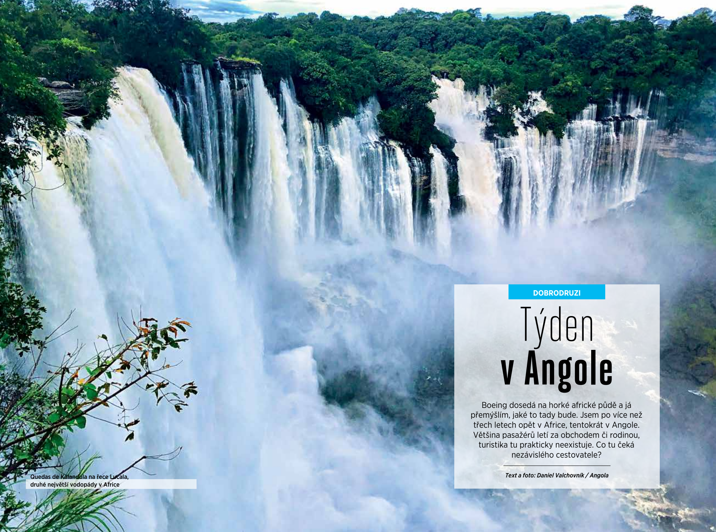
Quedas de Kalandula na řece Lucala, druhé největší vodopády v Africe