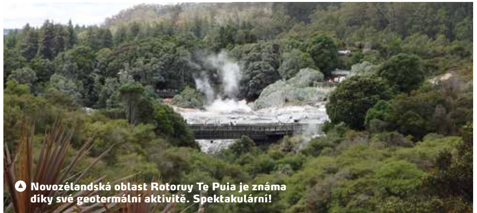
▲ Novozélandská oblast Rotoruy Te Puia je známa díky své geotermální aktivitě. Spektakulární!

no jako jednička na Zélandu a umístilo se v první čtyřicítce světového žebříčku těch nejlepších skvostů. Jedná se o osmnácti-jamkové hřiště, které navrhl v roce 2004 proslulý americký architekt Tom Doak: „Pokud by hřiště Cape Kidnappers byla kniha, byla by epická,“ vyjádřil se na adresu Cape Kidnappers s párem 71 a délkou nadprůměrných 6510 metrů. Hraje se nad