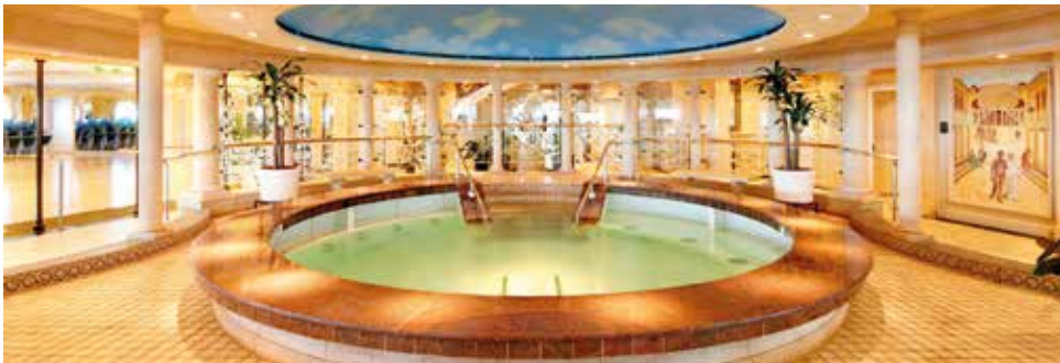
🕒 Jeden ze šesti bazénů na lodi Voyager of the Seas

laxace. Prvotřídní hřiště s ohromujícími výhledy na azurové vody Tichého oceánu navrhl světově proslulý profesionál a fidžijský rodák Vijay Singh na úchvatném pobřeží Coral Coast. Natadola Golf má předpoklady zařadit se mezi nejlepší hřiště světa. Náročný, mírně zvlněný terén s nádherně pěstěnými greeny, písečnými bunkery a až pěti odpališti u každé jamky, poskytuje víc než příjemné hrací podmínky. Sedm jamek je hraných směrem k pobřeží a oceánu. Klubovna v tradičním stylu poskytuje výhledy na hřiště a korálové útesy. Kromě golfu ostrov nabízí možnost odpočinout si, vychutnat krásu deštných pralesů, modravých lagun, korálových útesů a bohatého mořského života. Ideální je spojit golf s dalšími zajímavými aktivitami. Nastal čas se s ostrovy rozloučit a vydat se do dalších zatím nenavštívených míst krásné planety Země. Naše další cesta směřovala na exotické ostrovy Vanutu a do Nové Kaledonie, ale o tom zas jindy.